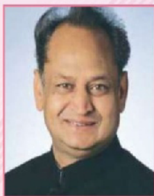
श्री अशोक गहलोत मुख्यमंत्री, राजस्थान