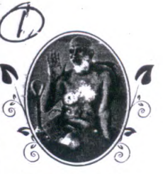
मुनिपुंगव श्री 108 सुधासागर जी महाराज