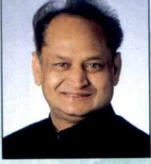
श्री अशोक गहलोत मुख्यमंत्री, राजस्थान