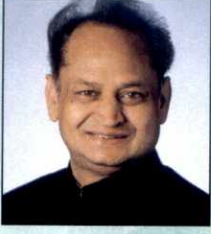
श्री अशोक गहलोत मुख्यमंत्री, राजस्थान