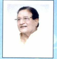
श्री शांति धारीवाल मंत्री, स्वायत्त शासन, नगरीय विकास एवं आवासन विभाग राजस्थान सरकार