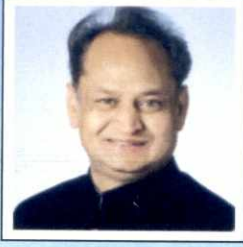
श्री अशोक गहलोत माननीय मुख्यमंत्री, राजस्थान