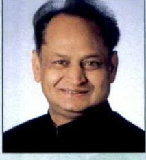
श्री अशोक गहलोत मुख्यमंत्री, राजस्थान