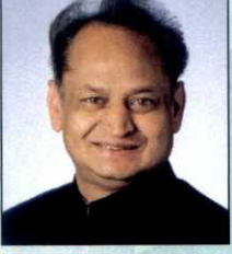
श्री अशोक गहलोत मुख्यमंत्री, राजस्थान